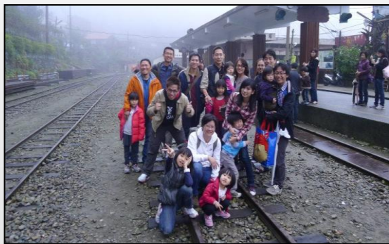
↑95 級系友於南投舉辦同學會，系友們攜家帶眷，即使畢業了還是一個溫馨的大家庭呢！