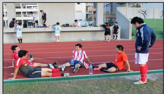
↑久未相聚後的聊天！