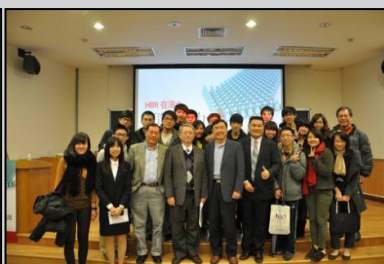
↑學生們與系友合影