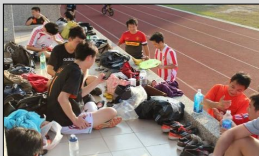
↑比賽前的熱身合影