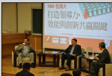
↑系友們分享管理經驗