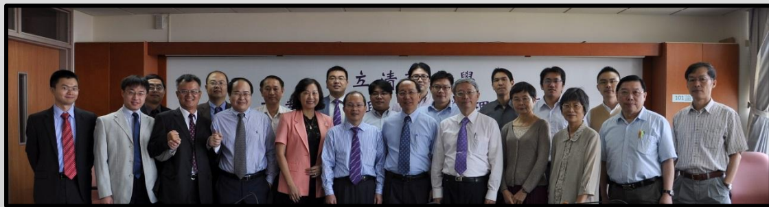
↑全體老師與北京清華教授合影

此次活動圓滿完成落幕，感謝各位老師、同學及參與人員的大力協助，相信藉由此次活動，俾利兩岸工業工程的合作及發展邁向新氣象、新指標。