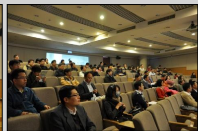
↑學生們專注聽講，滿堂喝采現場情形