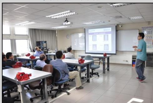
↑參觀服務創新工程實驗室