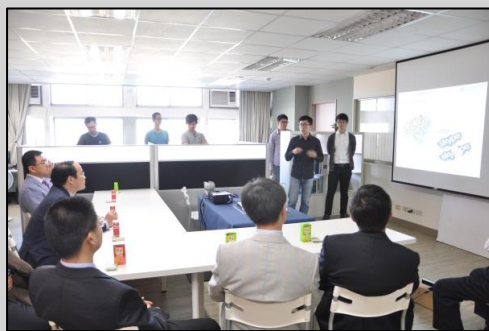
↑參觀產品開發實驗室