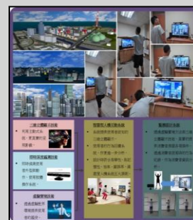
↑「智慧體感 3D 賞屋趣」展示海報