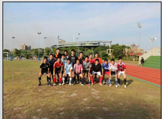
↑系足大家庭的合影，看起來相當熱血洋溢！